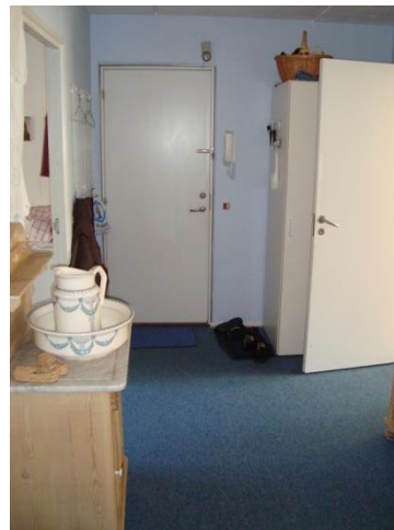
Entre (der er parketgulv under tæppet)

Bemærk venligst, at der kan være variationer i de enkelte boligtyper